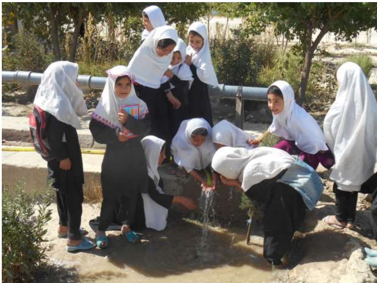
حفر چاه آب آشامیدنی برای ۴۰۰ تن شاگردان انانث .