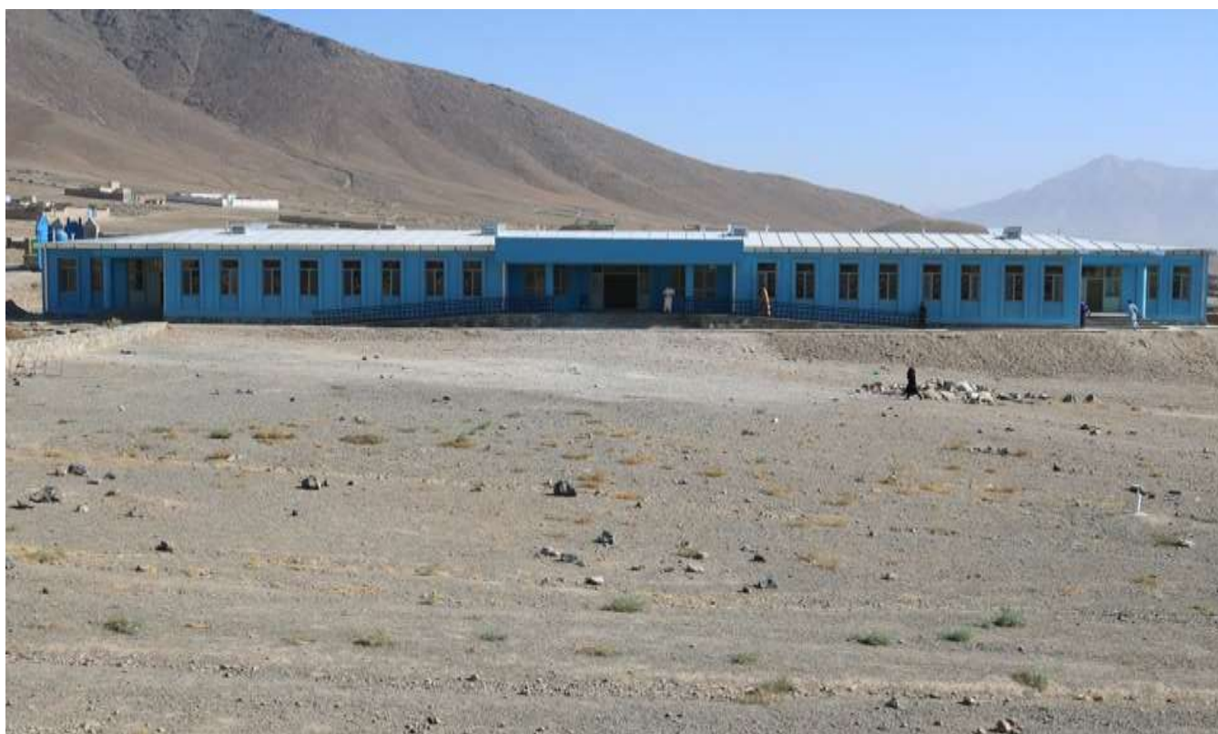
اعمار تعمیر مکتب شهید محمد سلیم لعل ستانکزی.