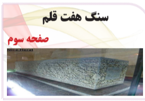
سنگ هفت قلم صفحه سوم