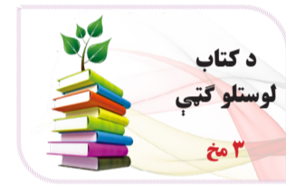
د کتاب لوستلو گټې ۳مخ