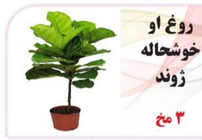
روغ او خوشحاله ژوند ۳مخ